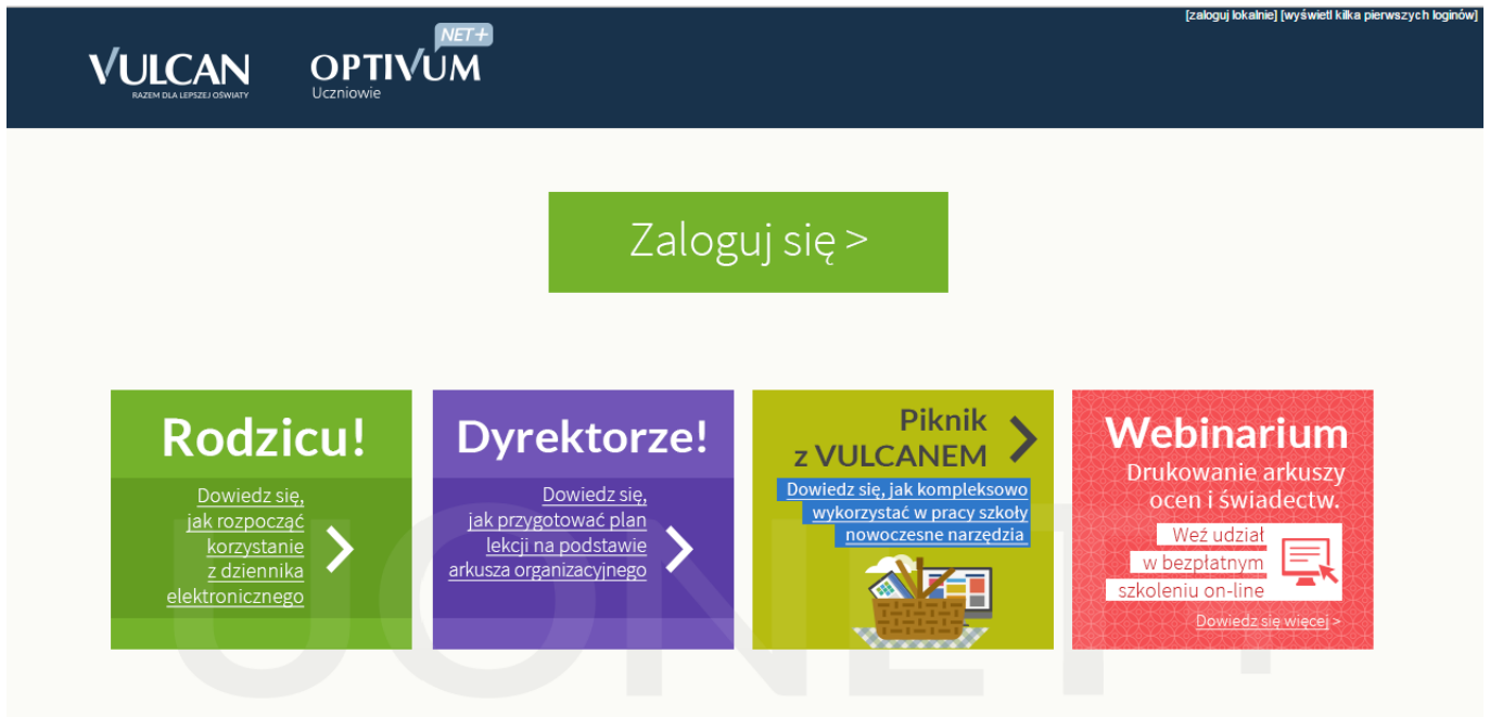
Rysunek 1. Strona główna systemu UONET+ przed logowaniem

Uruchom stronę https://uonetplus.vulcan.net.pl/pulawy , a następnie wciśnij przycisk Zaloguj się